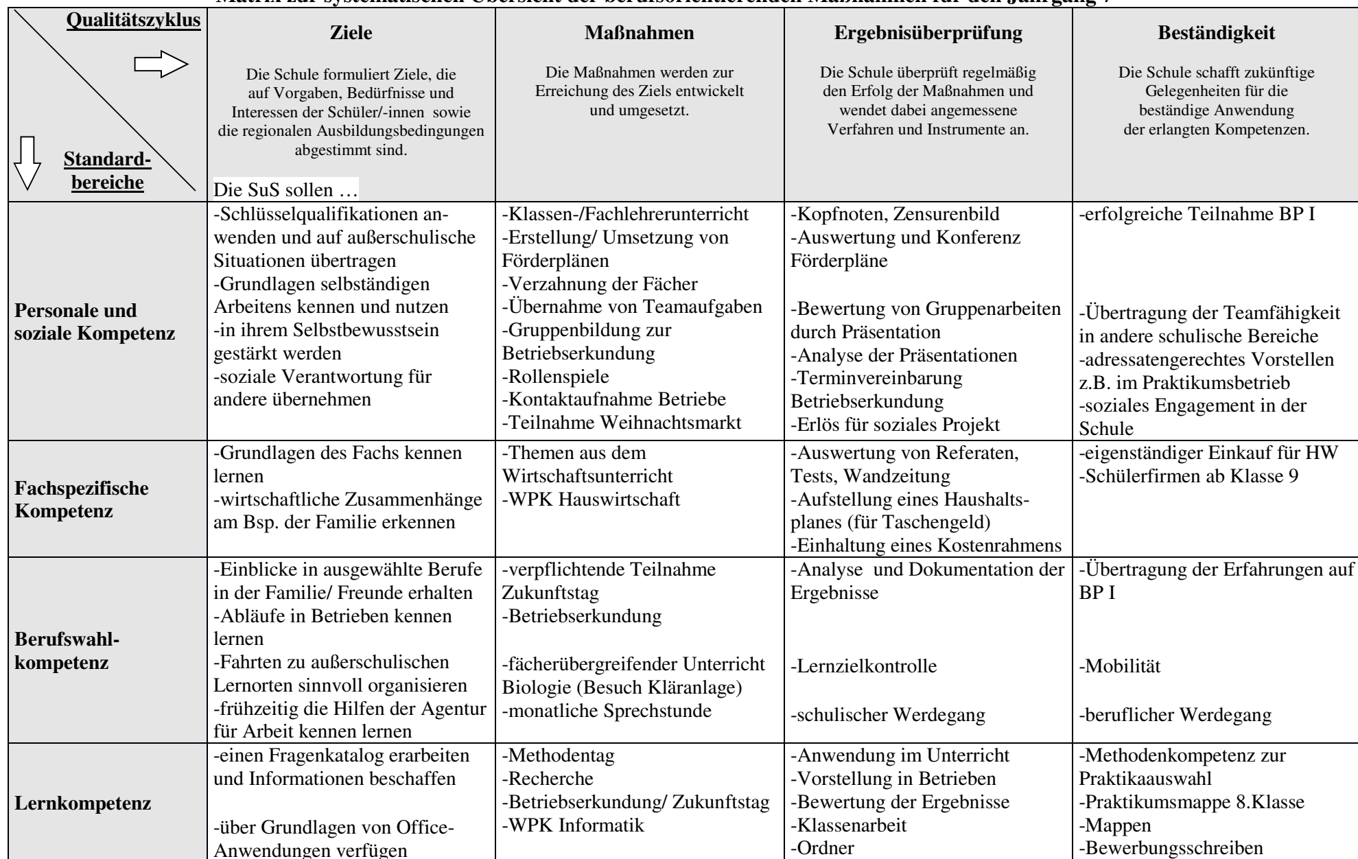
Matrix zur systematischen Übersicht der berufsorientierenden Maßnahmen für den Jahrgang 7